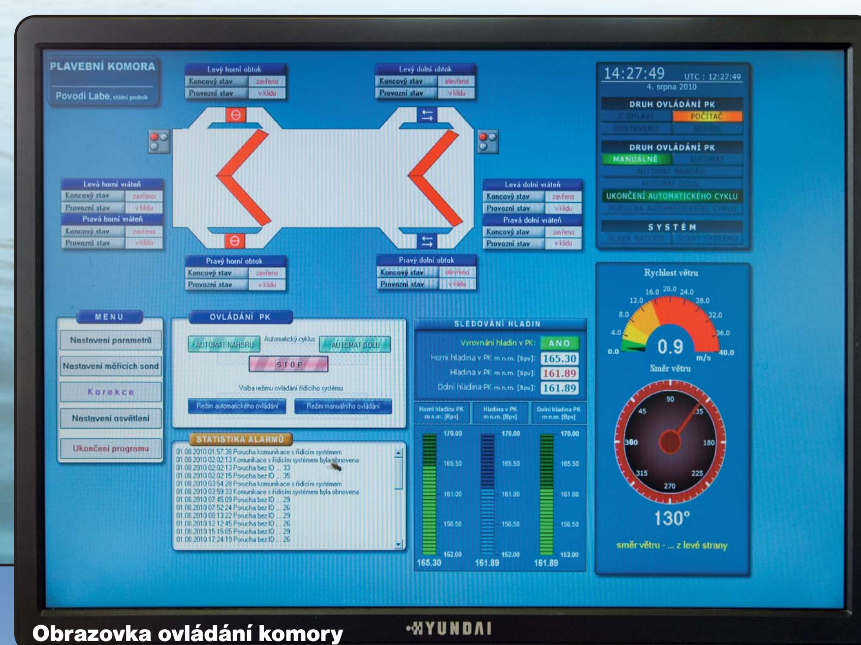
Obrazovka ovládání komory

Modernizace elektroinstalace včetně rozvaděčů, osvětlení a řídicího systému ovládání.