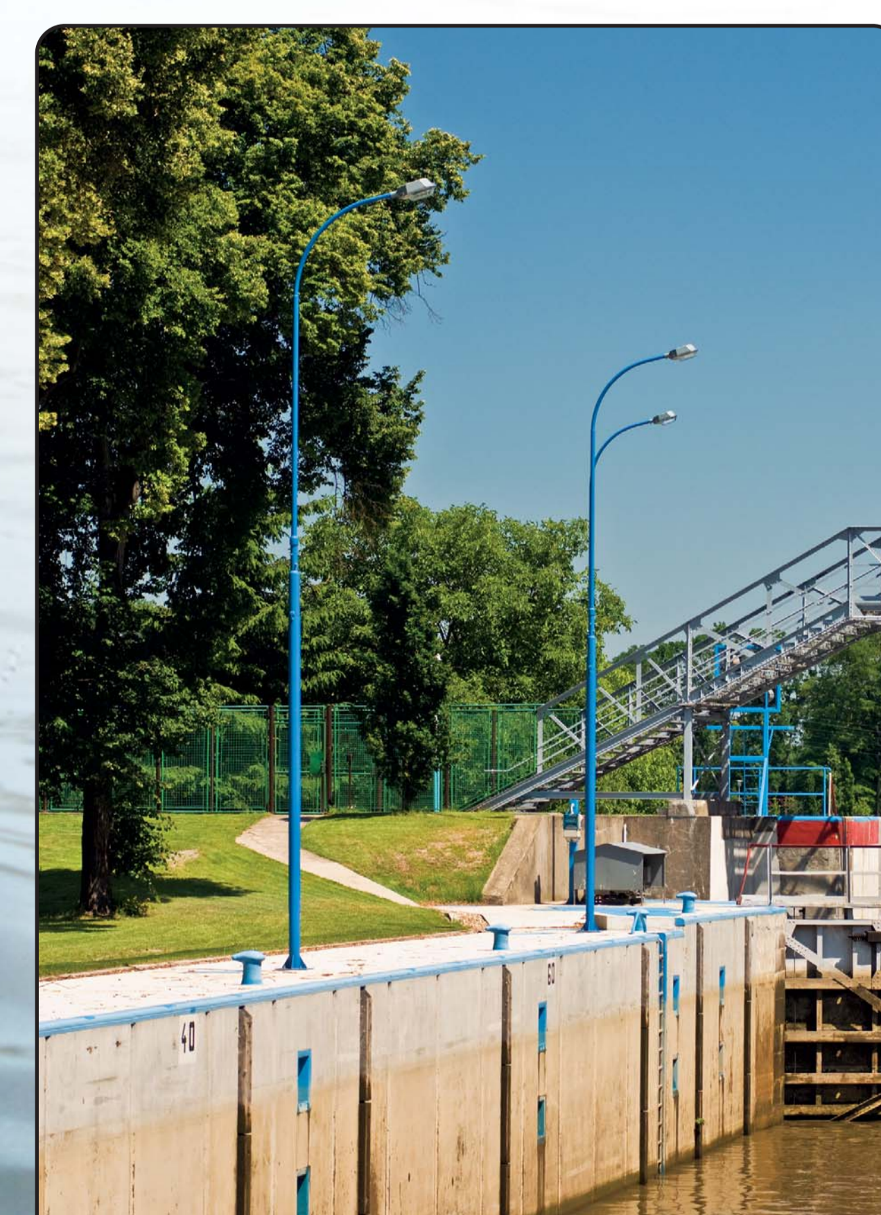
Stav po rekonstrukci